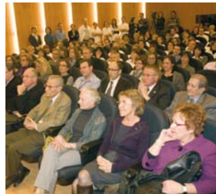
La renovada sala d'actes de l'Hospital de Vic plena de gom a gom