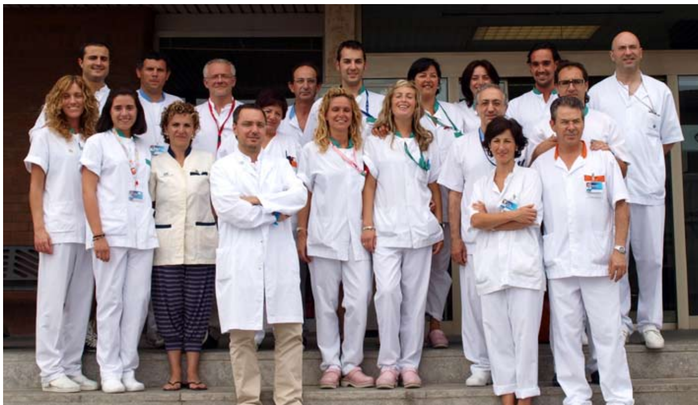
Membres de l'equip del servei de radiologia del CHV

Un equip de 38 professionals treballa al servei de diagnòstic per la imatge del Consorci Hospitalari de Vic