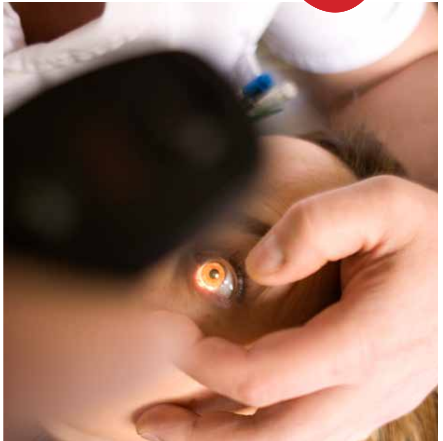
Les donacions de còrnia són les que més han augmentat en els últims mesos

Si una donació d'òrgans pot arribar a sis beneficiaris, en el cas dels teixits un sol donant pot salvar o millorar la vida de fins a 100 persones. En la donació s'obtenen teixits sans -com vàlvules, ossos, tendons o pell- per trasplantar-los a persones que els necessiten per poder millorar la seva salut i la seva qualitat de vida. En moltes ocasions, el trasplantament és l'únic recurs de què disposen per poder ser tractats.