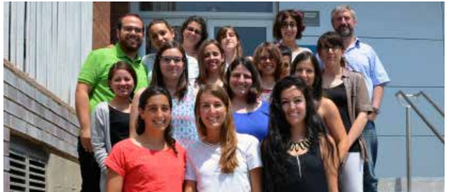
Nova promoció de MIR i IIR

Després de passar entre 2 i 5 anys de formació, segons la seva especialitat, un total de 13 residents formats al Consorci han finalitzat enguany l'etapa docent per convertir-se en professionals en les seves respectives especialitats. El 5 de maig, es va celebrar a l'Hospital Universitari de Vic un acte