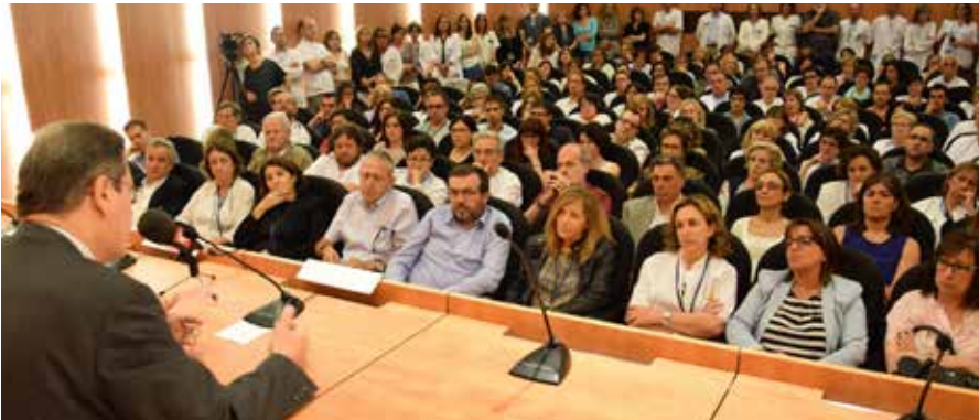
Unes 170 persones van omplir la Sala d'actes de l'HUV –i més d'un centenar se'n van quedar fora per falta d'aforament–, per assistir a la presentació pública del nou director general