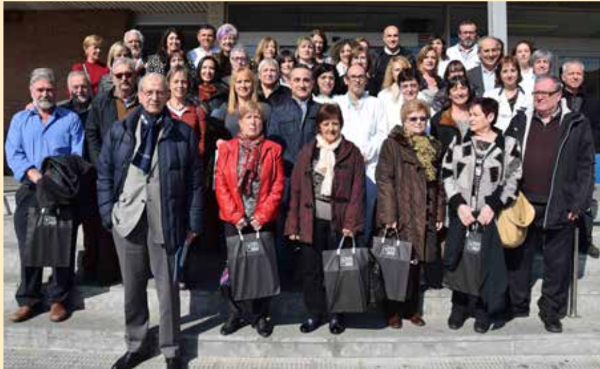
Foto de família dels homenatjats, a les escales de l'entrada principal de l'Hospital Universitari de Vic.

E l passat mes de febrer, 19 professionals del Consorci Hospitalari de Vic que s'havien jubilat l'any 2015 van rebre un guardó a la trajec-