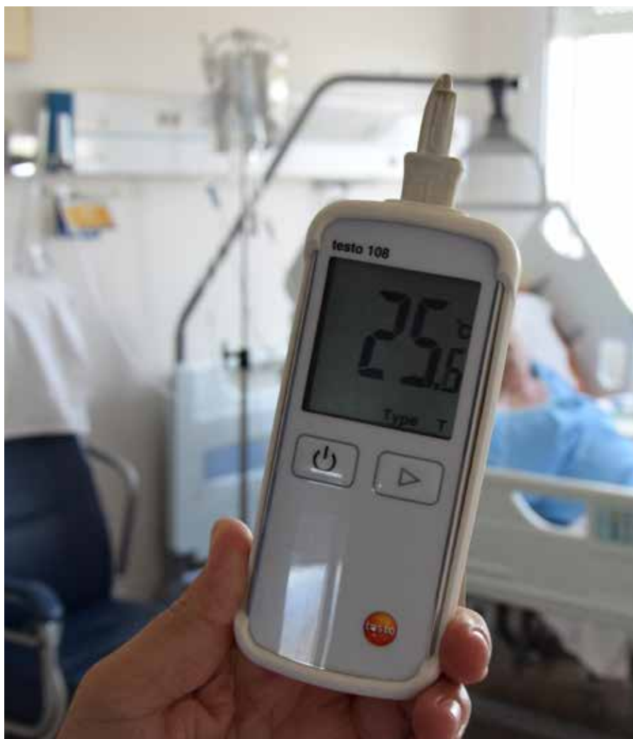
La nova climatització ja arriba a totes les habitacions i unitats d'hospitalització de les nou plantes de l'Hospital Universitari Vic.

>>> ració i benestar-, i també dels familiars i dels professionals.