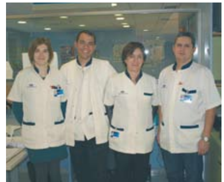
Serveis administratius d'Osona Salut Mental