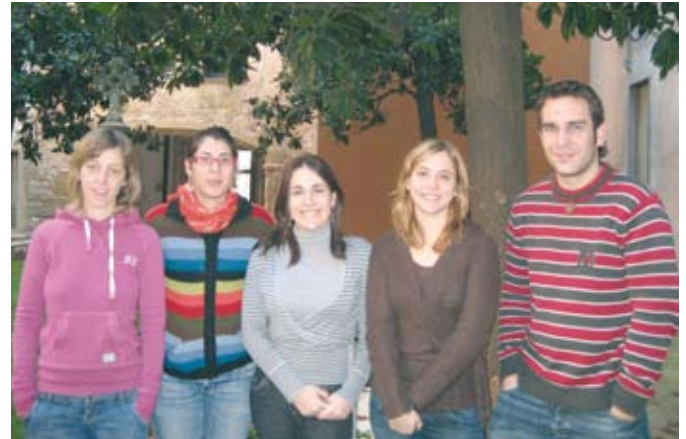
Les fotos corresponen a professionals que treballen en aspectes més socials. D'esquerra a dreta i de dalt a baix: equips d'inserció laboral, rehabilitació, habitatge i centre de dia