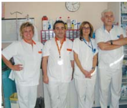
Professionals d'infermeria que treballen a hospitalització