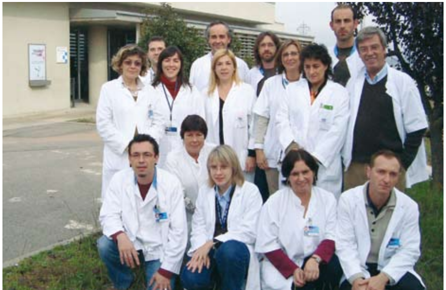
Equips de professionals especialitzats en malalties mentals que exerceixen als dispositius assistencials d'Osona