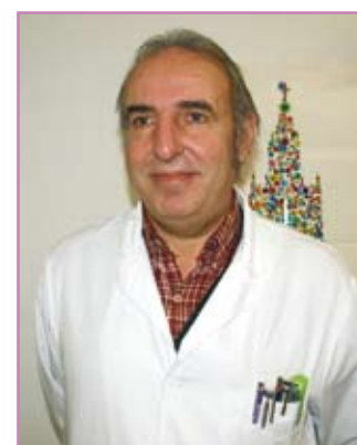
Els professionals del CHV que pertanyen al Grup D, també dit de Màster

etc... Pel que fa a docència i recerca, es té en compte la participació com a col·laborador en treballs d'investigació i publicacions científiques, el treball i tutoria en línies de recerca i l'obtenció del doctorat. Finalment, altres mèrits que es valo-