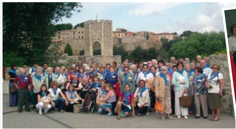
El passat mes de juny els usuaris de la Residència, l'Hospital i el Centre de Dia van anar d'excursió a Besalú, tot i estrenant el nou túnel de Bracons

les seves habilitats i el seu interès per aspectes culturals i lúdics.