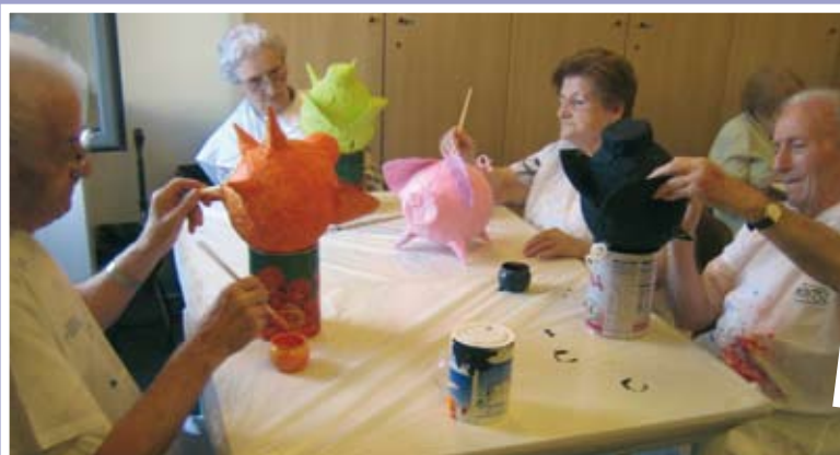
Els usuaris del Centre de Dia realitzen tot tipus de tallers de manualitats, com aquest que es veu a la imatge