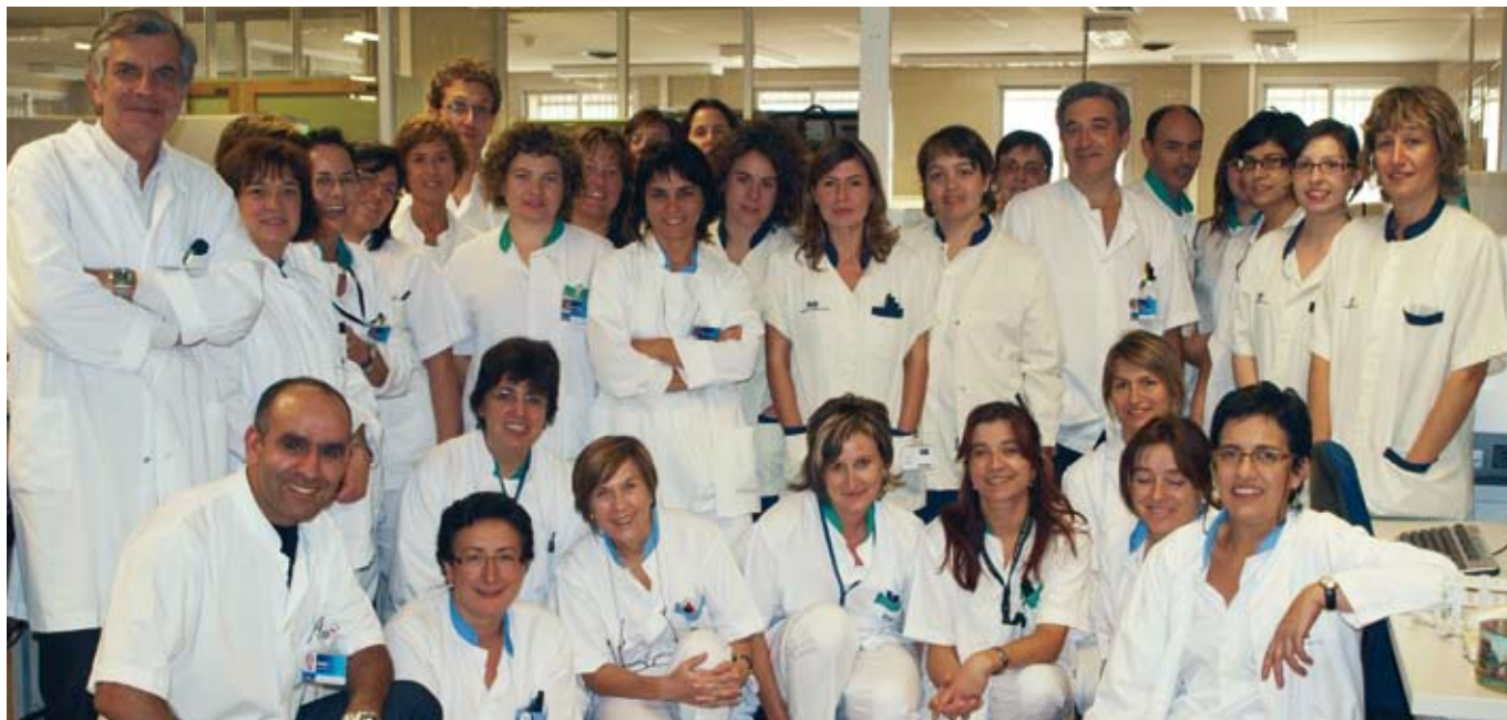
Membres de l'equip del servei de laboratori del CHV

que pot fer-se les proves que calgui al centre sanitari que tingui més a prop, estalviant-se el trasllat a l'hospital.