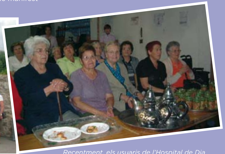
Recentment, els usuaris de l'Hospital de Dia van visitar la mesquita que es troba a sota de l'hospital. Els van oferir te i pastes i van poder conèixer una cultura que molts desconeixien