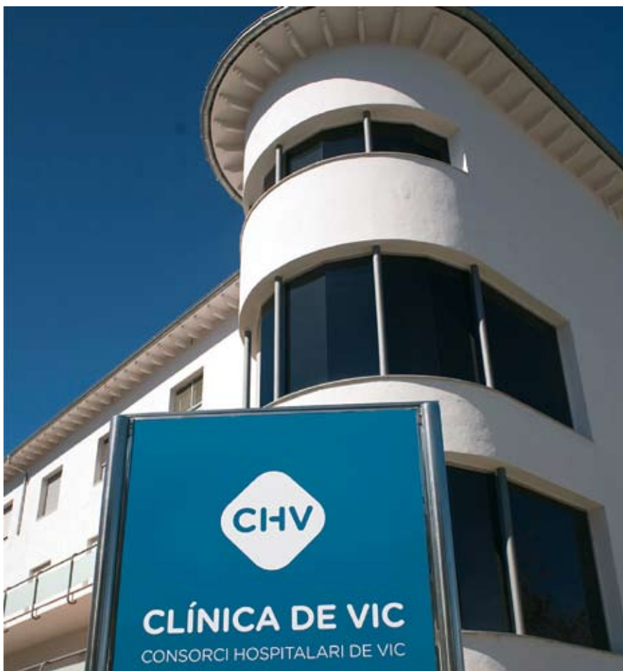
La Clínica de Vic és la porta d'entrada de l'assistència mutual i privada

El procés de trasllat de l'hospitalització a l'HGV s'està fent de forma gradual. A banda dels parts, al-