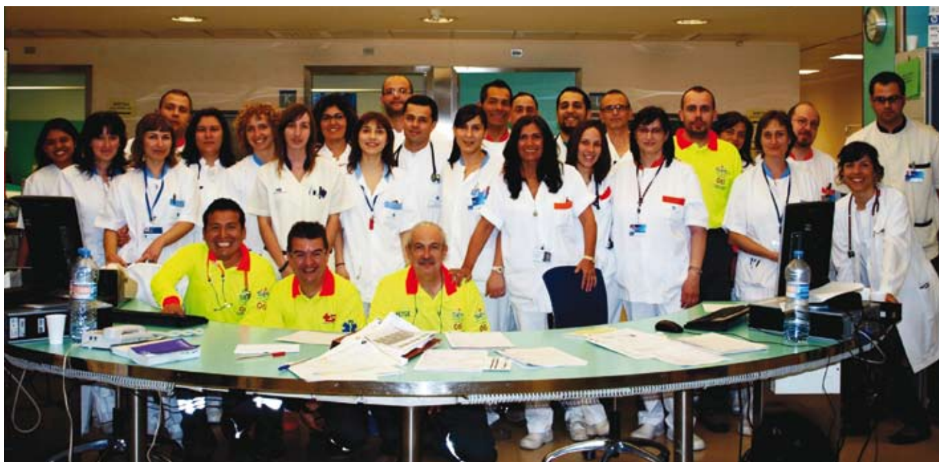
L'equip del servei d'urgències del CHV

comunicació en les sales d'espera, com a primer pas per a fer-ho, es vol disposar de material informatiu adreçat a l'usuari traduït a diversos idiomes.